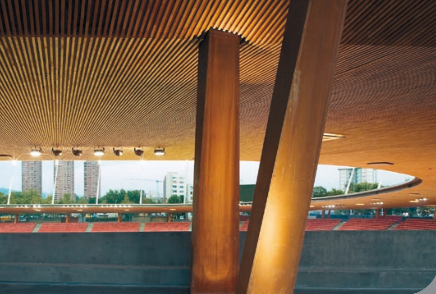
Stadion Letzigrund, Zürich (Prix Acier 2007)