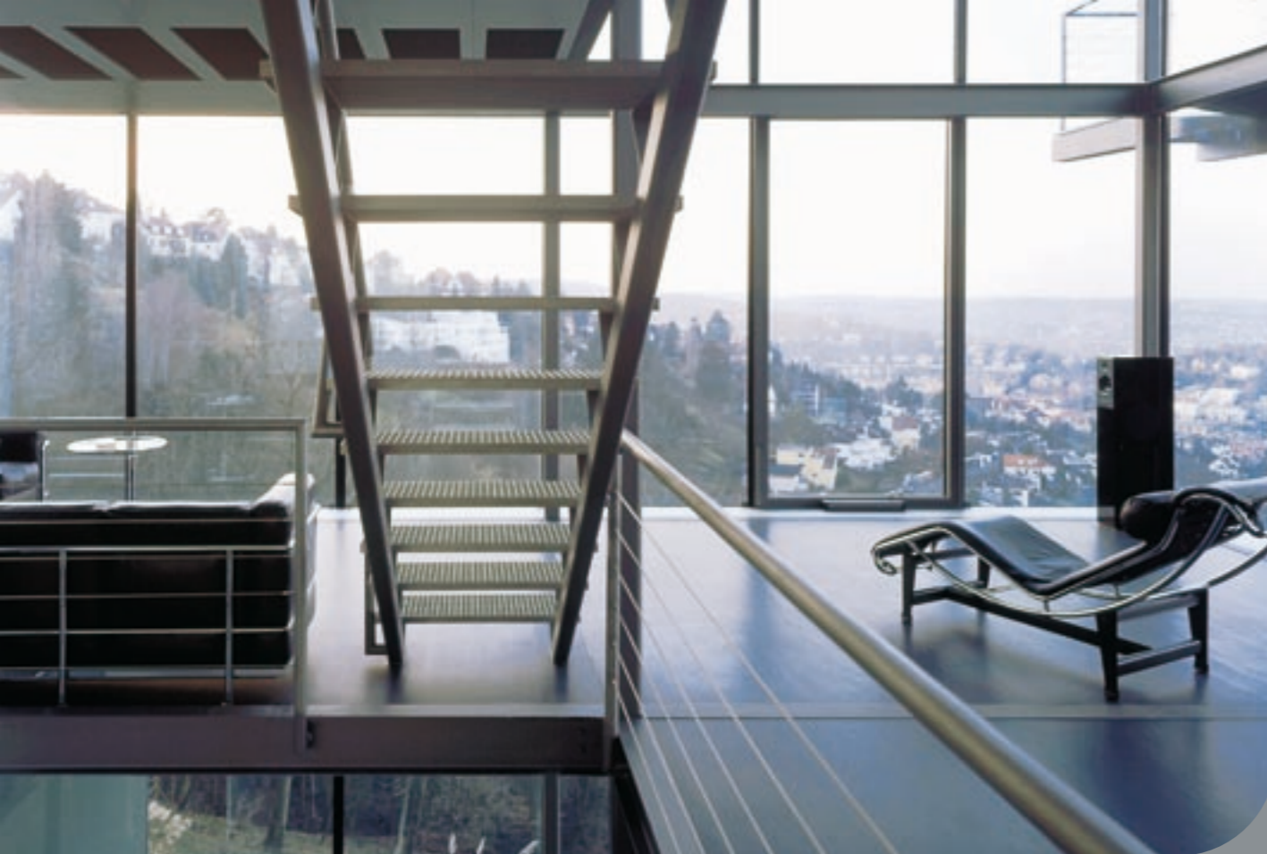
Haus Sobek, Stuttgart (Null-Energie-Haus, 2001)

Der Stahlbau ist eine Leichtbauweise, die diese Vorteile der Trennbarkeit bietet. Zudem kann ein Stahlbau beliebig und günstig erweitert, aufgestockt oder verkleinert werden, wenn sich die Nutzungsbedürfnisse der Bauherrschaft verändern.