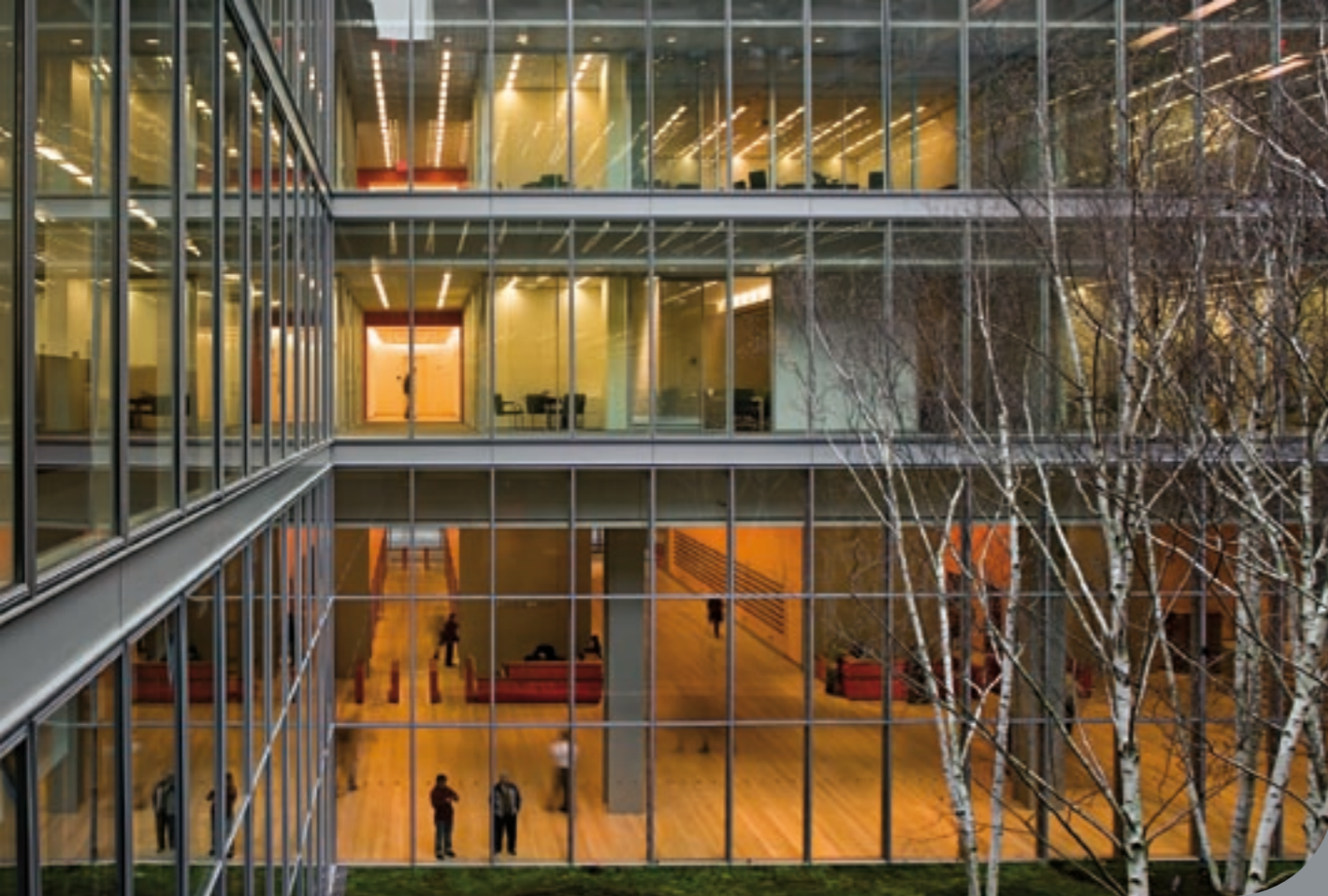
New York Times Building, New York (2007)