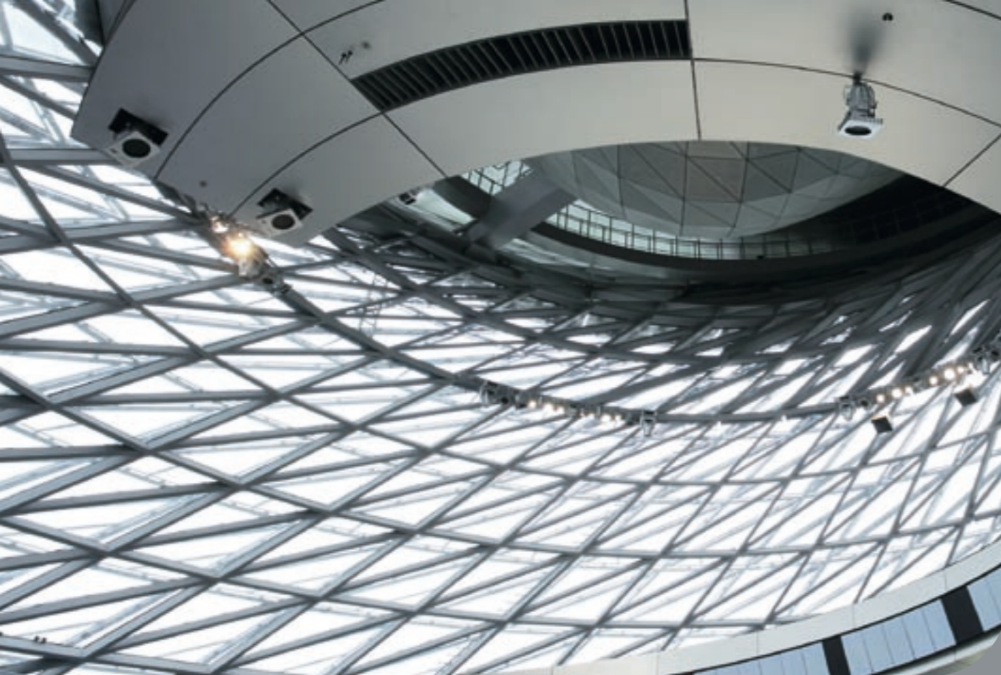
BMW Welt, München (2007)