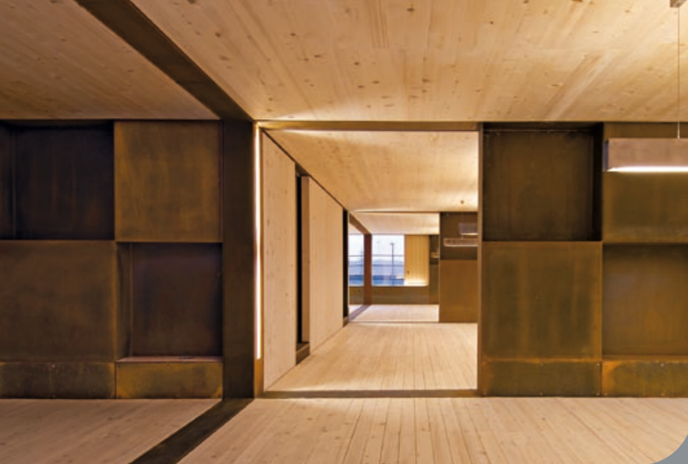
Werk- und Denklabor Pauker, Friedberg D (Preis des Deutschen Stahlbaus 2008)